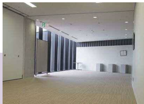
第3小会議室と一体的に利用時 [83㎡]